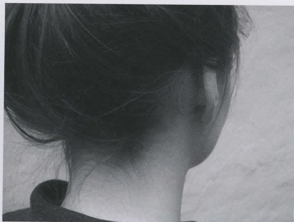
379-380. LARS EMBÄCK Images from The Voices , 2012.

Lars Embäck (b. 1955) does installations about how he grew up in a flat in the Gothenburg suburb of Högsbo, part of the so-called One Million Homes programme. He creates tableaux of furniture and details that corroborate his own experiences. Often he assembles these settings in books. We see ambiances, echo chambers of the past and how it is still active now. In The Voices (2012), he adds fragment to fragment. Pictures from return visits in black and white, profiles, heads, no portraits, past and present in double exposures: “I climb the stairs and ring our doorbell. The flat is filled with police who bring me into the living room. The police are talking to Mum who is screaming.”